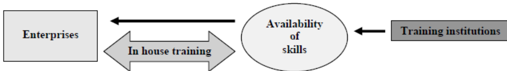
Figure 4.1 Education and training for entrepreneurship: assessment framework